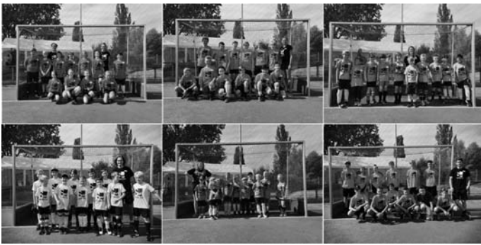
Ein farbenfrohes Bild der Trainingsgruppen mit ihren Trainern beim Sommercamp

Und es funktionierte. Das übliche Konzept des Ferien-camps wurde neu aufgesetzt: Die Gruppen wurden verkleinert, alle Spieler erhielten T-Shirts in unterschiedlichen Farben, so dass die Abstandsregeln besser einzuhalten waren. Hockey spielen war also auch Corona-konform möglich. Es wurde normal, mit Abstand und nur gruppenweise den Platz zu betreten. Als Team hatte man immer seinen festgelegten „Standort“. Hier hielt man sich während der Pausen auf und nur hier wurde als Team gegessen.