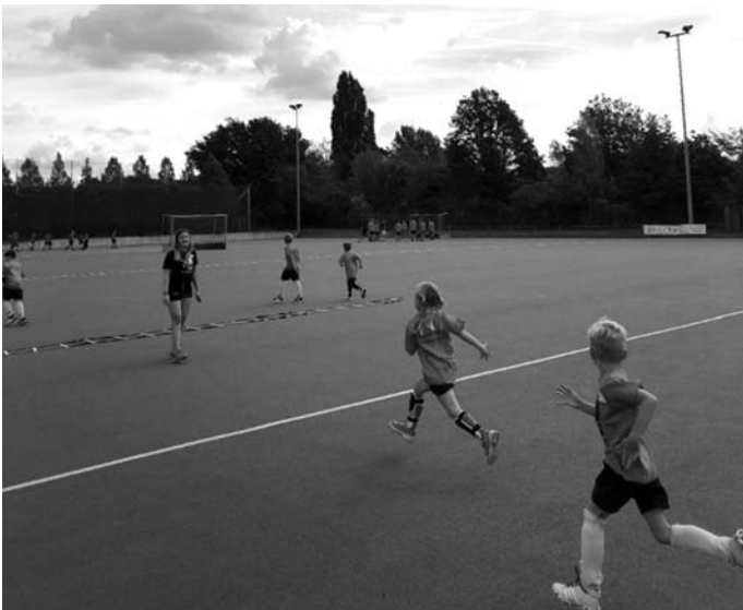
Es wurde nicht nur Hockey gespielt, sondern auch spielerisch die Athletik der jungen Sportler entwickelt

Und es funktionierte. Das übliche Konzept des Ferien-camps wurde neu aufgesetzt: Die Gruppen wurden verkleinert, alle Spieler erhielten T-Shirts in unterschiedlichen Farben, so dass die Abstandsregeln besser einzuhalten waren. Hockey spielen war also auch Corona-konform möglich. Es wurde normal, mit Abstand und nur gruppenweise den Platz zu betreten. Als Team hatte man immer seinen festgelegten „Standort“. Hier hielt man sich während der Pausen auf und nur hier wurde als Team gegessen.