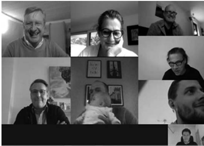
Vorstandssitzung in Pandemiezeiten

Voller Hoffnung haben wir nach den Sommerferien die Feldsaison wieder aufgenommen. Leider aber auch nicht für eine lange Zeit. Schon im September kam der Sport wieder zum Erliegen. Bis heute gab es kein Spiel mehr auf dem Feld, geschweige denn die Hallensaison wurde begonnen. Kein Wildsau-/ Feikes Turnier, kein Familienhockeytag und keine weiteren sportlichen Erfolge.