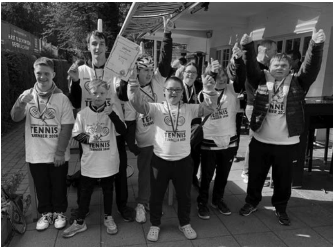
Die Teilnehmer des CSV Marathon beim Turnier

Die Inklusionsgruppe lief auch in 2020 sehr gut – die Gruppe ist inzwischen auf 12 Aktive gewachsen. Alle trainieren regelmäßig, und das sowohl im Sommer als auch im Winter in der Halle; sie sind mit großem Spaß dabei und machen beim Tennis große Fortschritte. Durch Zuschüsse von Aktion Mensch, des LSBs sowie durch Spenden kann das Training für die Sportler weiterhin kostenlos angeboten werden. Zudem gab es in der Presse einige Berichte über diese Aktivität.